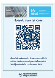
1. ใช้ Line สแกน QR Code