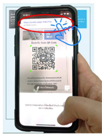
2. กดลิงค์ เพื่อเข้า Web BKI